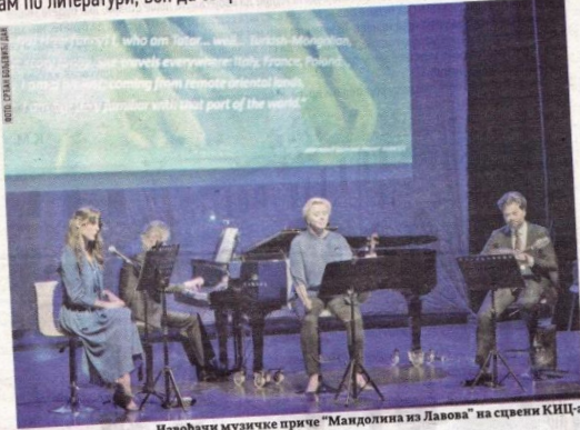
Извођачи музичке приче "Мандолина из Лавова" на сцвени КИЦ-г

торка и мандолије Мартино. као што је раније наја ла Серна, ово је прича не само о Лавову, већ о Европи, о пре-вирањима, историјским, му зичким, личним, у Италији Француској, Пољској, Чеш кој, СССР-у Украјини. Зато ј ова музичка при чаторе емоција, изражених кроз му-зику једнако као и кроз при-че татарског шешира, мандо-лине и виолине, који потичу из различитих историјских